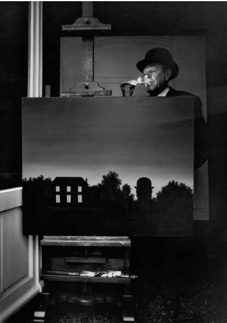
Foto gemaakt door Marcel Broodthaers van René Magritte in zijn huis, 1964 © THE ESTATE OF MARCEL BROODTHAERS, BELGIUM / FOTO: MARCEL BROODTHAERS

net om de boodschap duidelijker te maken. Een boodschap is het niet, ook geen symbool, wel een zichtbaar maken van het geheimzinnige, dus van de poëzie van het universum. Het is geschilderd in een zo onopvallend mogelijke stijl, met weglating van alle ogenschijnlijke virtuositeit of originele penseelvoering. Ook dat is typisch 'magrittiaans': de zeggingskracht van het beeld primeert. Met dit werk wordt ook de stelling ontzenuwd dat na de internationale erkenning het bergaf ging met Magrittes inspiratie en dat hij slechts variaties op ouder werk produceerde. Dit onbeschreven blad was toevallig zijn laatste.