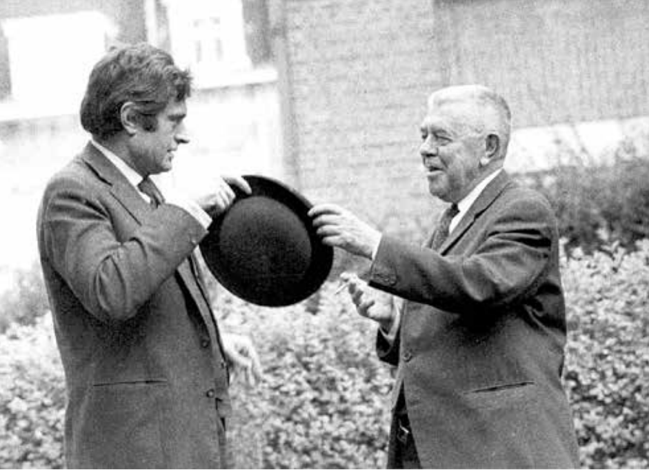
Marcel Broodthaers en René Magritte, 1967