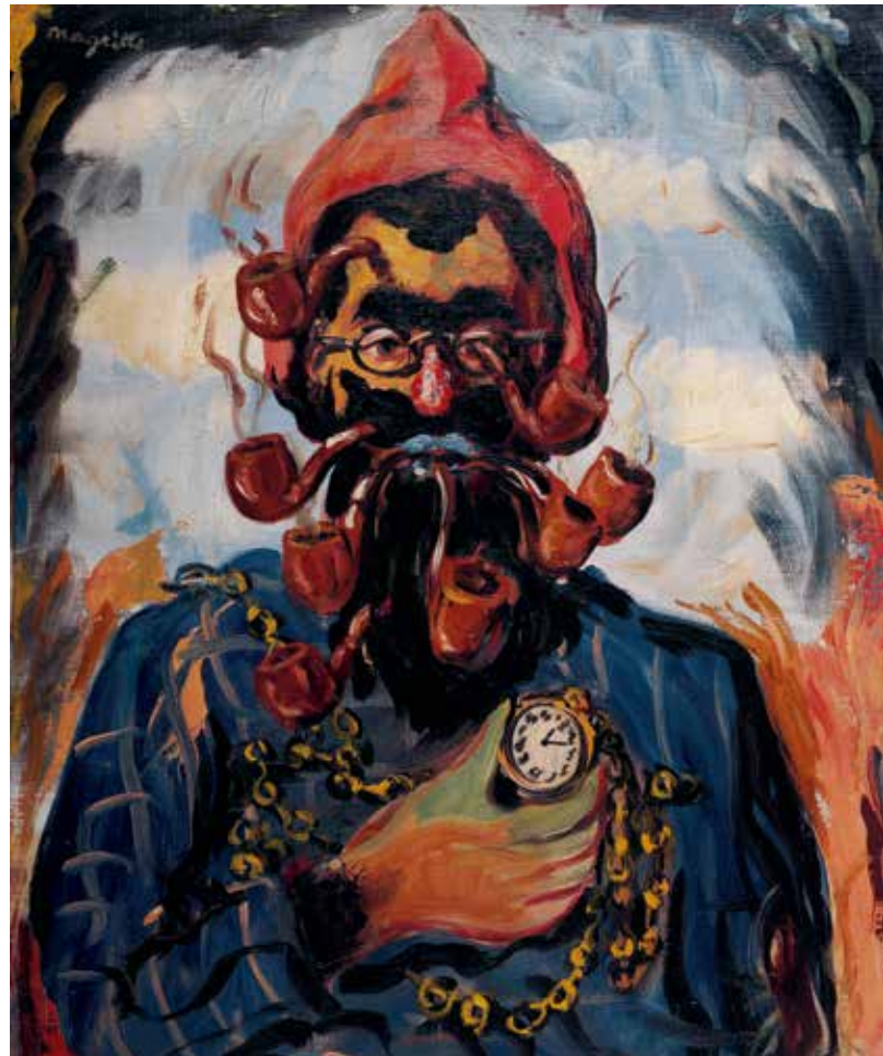
René Magritte, De kreupele , 1948

Dat brengt ons terug bij de opener van de tentoonstelling: La page blanche (het onbeschreven blad), zoals gezegd zijn laatste werk. De onoplettende toeschouwer ziet hierin slechts een rustig nachtelijk tafereel met een volle maan en gebladerde. Dan pas dringt het door dat de maan niet tussen of achter het gebladerde zit, maar ervoor. In extremis heeft Magritte het maansikkeltje vervangen door een volle maan,