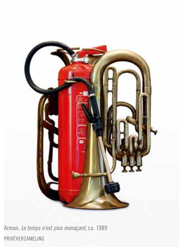
Arman, Le temps n'est plus menaçant , ca. 1989