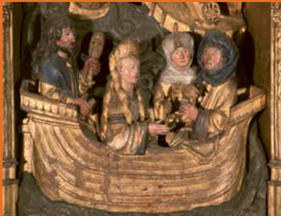
Sint-Dimpnaretabel (ca. 1515), detail Sint-Dimpnakerk, Geel

De Topstukkenraad nam dan het initiatief om hiaten in te vullen wat betreft zestiende-eeuws beeldhouwwerk, dat toen in de Zuidelijke Nederlanden hoogtij vierde. Dat resulteerde op 2 december 2014 in een lijst van achttien objecten, waaronder vijf retabels.