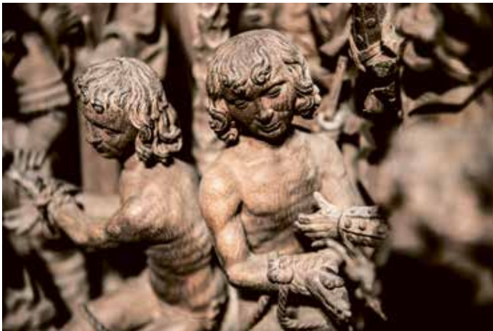
Detail uit het retabel: ondanks de vele gruwelijke folteringen blijven de broers er elegant uitzien