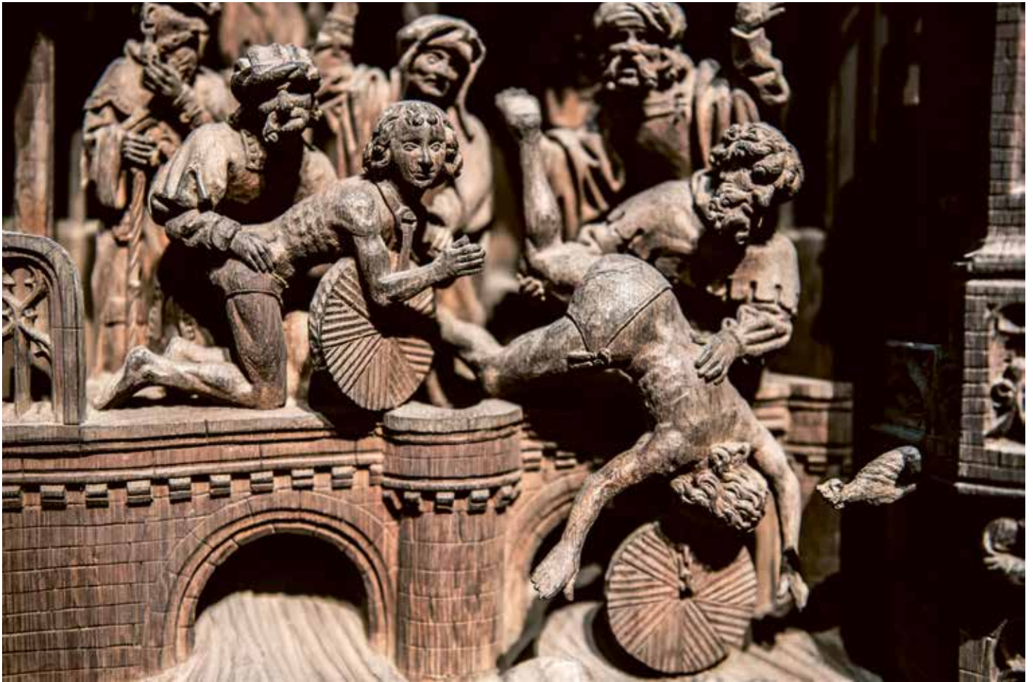
Detail uit het retabel: met molenstenen aan hun nekken worden de twee Romeinse jongelingen in de rivier Aisne gegooid