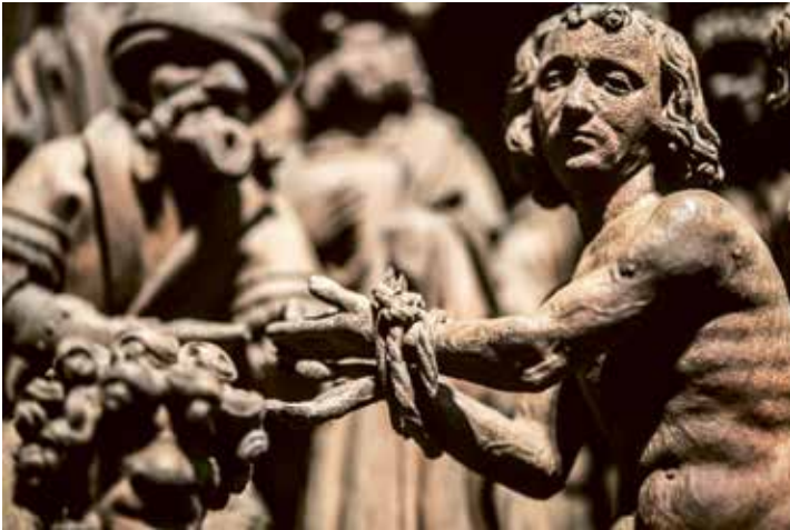
Passier Borman wist het verhaal van Crispinus en Crispinianus pakkend te vertellen