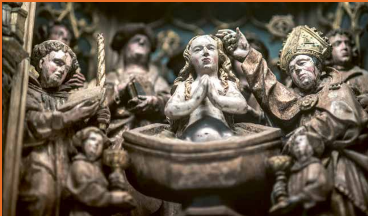
Retabel van de heilige Columba (ca. 1535); detail Sint-Columbakerk, Deerlijk

Wat alle elf de retabels op de Topstukkenlijst gemeen hebben is hun grote artistieke waarde door de verbluffende kwaliteit van het houtsnijwerk.