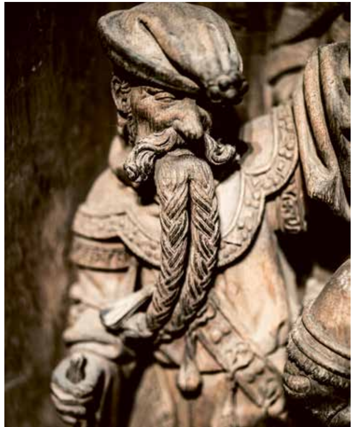
Detail uit het retabel: rechter Rictiovarus laat Crispinus en Crispianus gevangen nemen, folteren en doden