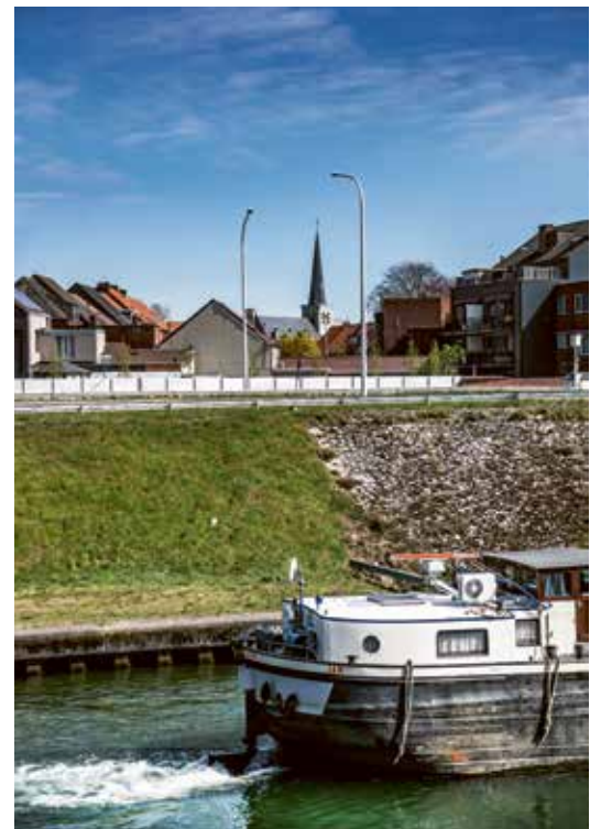
De Sint-Waldetrudiskerk in Herentals

In Engeland liet Cromwell cynisch de beenderen van de heilige Thomas Beckett opgraven in de abdij van Canterbury en opbergen in de kelder van zijn privéwoning; een heilige die ooit een koning had uitgedaagd, dat kon niet! Relieken en beelden van andere heiligen volgden gestaag, waaronder die van de heiligen Crispinus en Crispinianus, vereerd in Faversham Abbey. Cromwell liet de kloosters en abdijen van Engeland sluiten en stortte de opbrengsten grotendeels in de schatkist van Hendrik VIII. Het rad der fortuin draaide voort en de almachtige gerant Cromwell stierf zelf als verrader op het schavot in 1540, een kwarteeuw voordat in onze gewesten de Beeldenstorm woedde. Cromwell zou de Beeldenstorm, de vernietiging van religieuze kunst, volmondig hebben toegejuicht. Het retabel van Crispinus en Crispinianus in Herentals overleefde deze uitbarsting van iconoclasme. Weer een kwarteeuw later schreef William Shakespeare de monoloog van de Engelse vorst Henry V voor de slag van Agincourt in 1425: And Crispin Crispian shall ne'er go by, /From this day to the ending of the world, /But we in it shall be rememberèd /We few, we happy few, we band of brothers... De slag werd uitgevochten op 25 oktober, de feestdag van de beide heiligen, en de Engelsen wonnen. St Crispin's day bleef dankzij Shakespeare spreekwoordelijk in het Angelsaksische taalgebied.