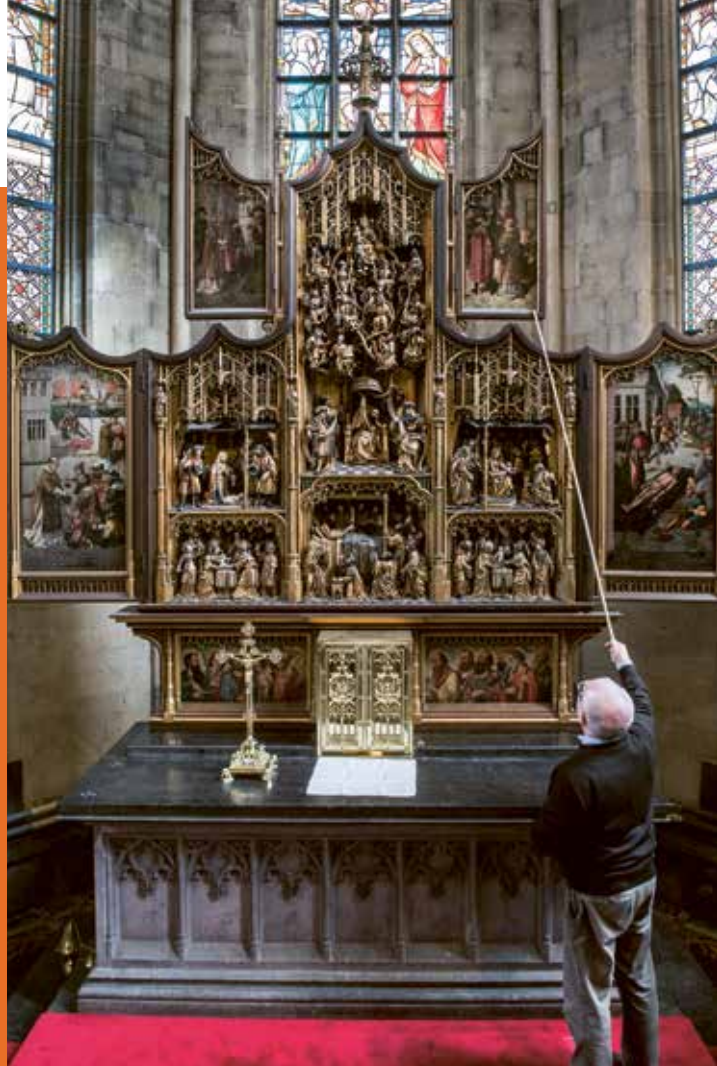
Mariaretabel (ca. 1525) Sint-Laurentiuskerk, Bocholt